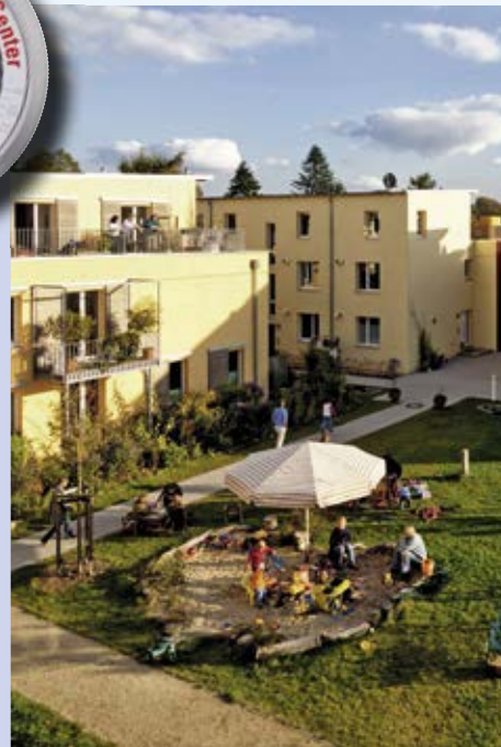
energy-efficient buildings in Klein Borstel