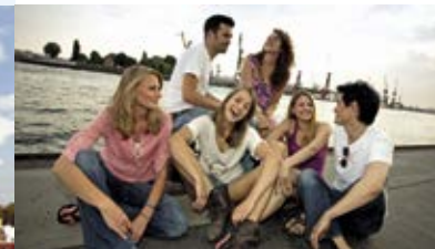
Internationale Studierende international students

You can also find a great deal of information at www.welcome.hamburg.de